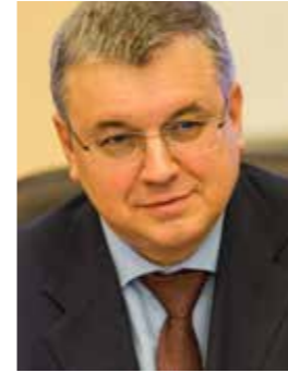
Я. И. Кузьминов Ректор НИУ ВШЭ