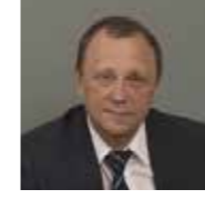
Александр Соболев, директор Департамента государственной политики в сфере высшего образования Министерства образования и науки РФ