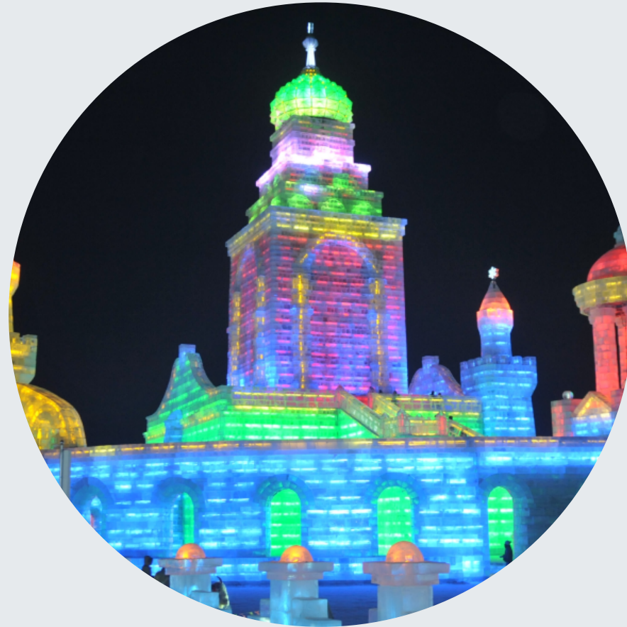
Мир льда и снега

Студенты могут применить свои языковые навыки в реальной культурной среде!