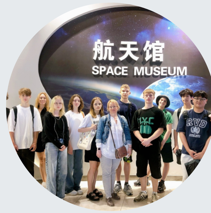
Музей ХПУ&Музей КОСМОНАВТИКИ