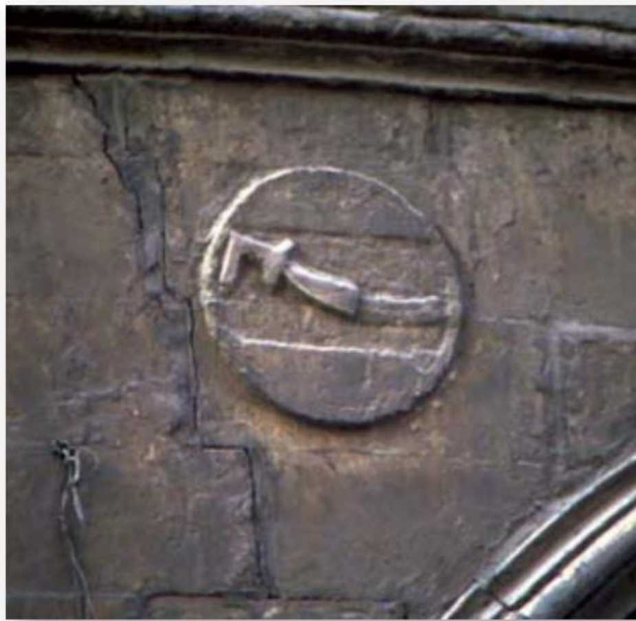
Хранитель меча (سلاحدار)