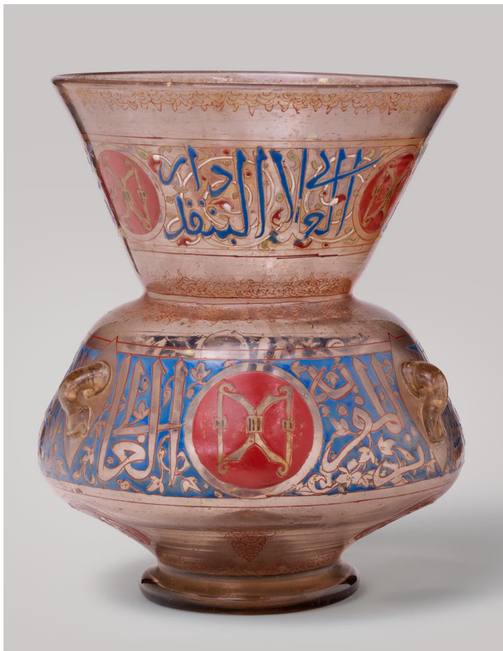
Хранитель лука (بندقدار)