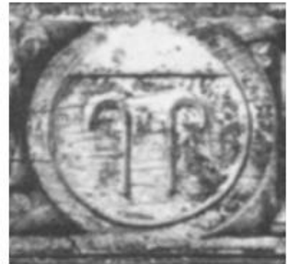
Мастер для игры в поло (جکندار)