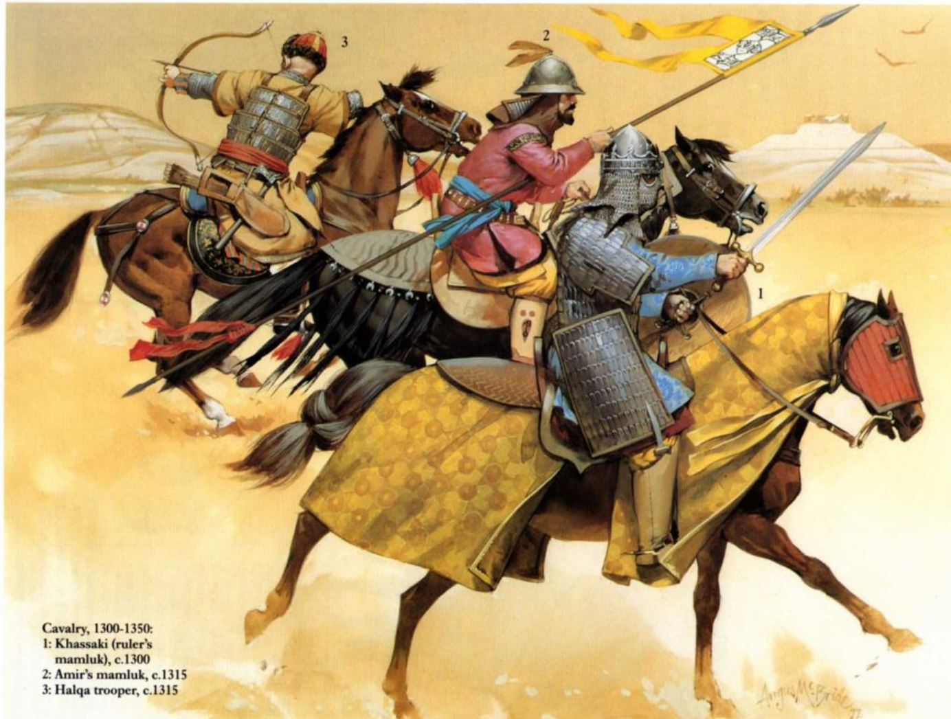
Cavalry, 1300-1350: 1: Khassaki (ruler's mamluk), c.1300 2: Amir's mamluk, c.1315 3: Halqa trooper, c.1315

Кавалерия, 1300-1350: 1. Хассаки 2. Мамлюк эмира. 3. Пехотинец халка.