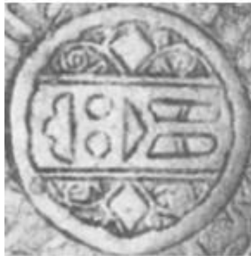
Хранитель чернильницы (دوادار)