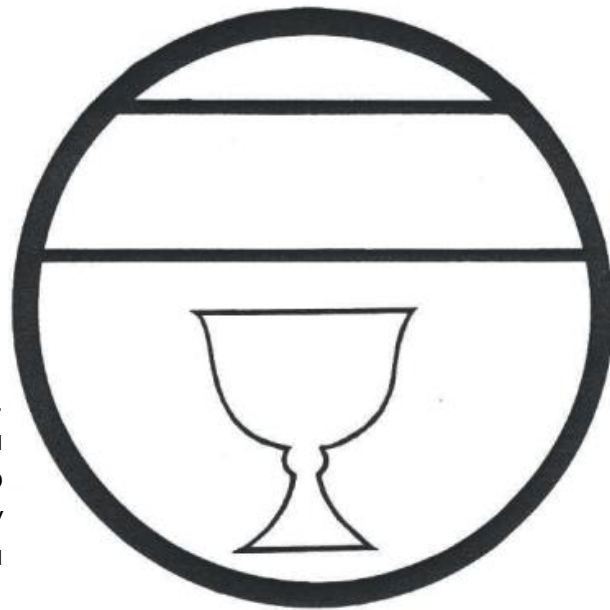
Герб султана Аль-Адила Китбуга. Изображение взято с основания инкрустированного латунного подсвечника, изготовленного по заказу Китбуги. Художественная галерея Уолтерса, Балтимор