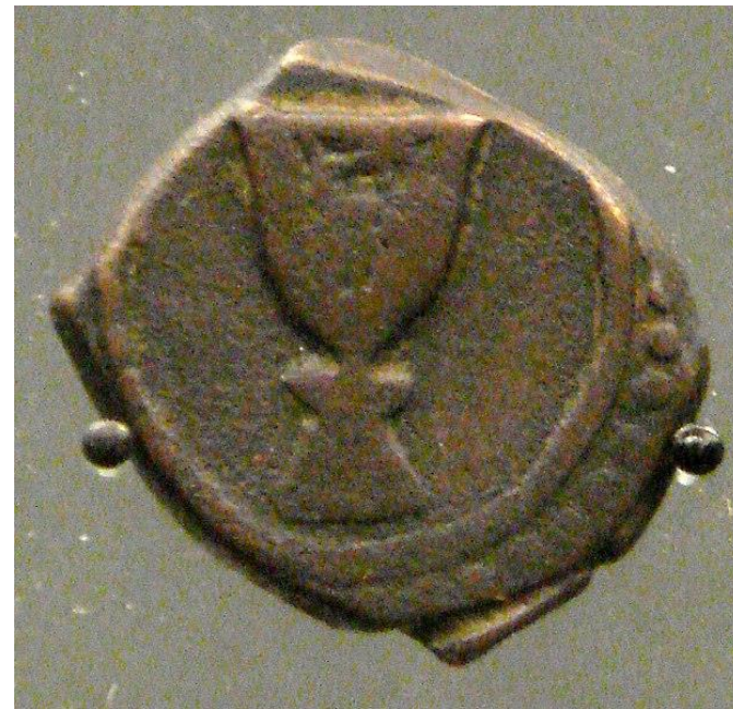
Монета с изображением чаши, выпущенная во время правления последнего султана династии Бахритов Ас-Салиха Хадджи II (1382, 1389-1390)