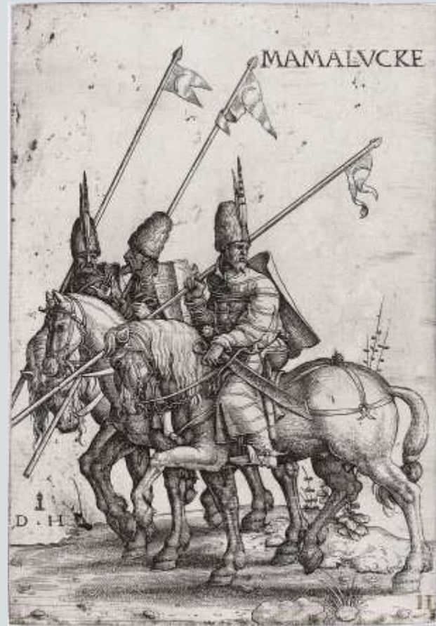
Османские копейщики мамлюков, начало XVI века. Офорт Дэниела Хопфера (около 1526–1536 гг.), Британский музей, Лондон.