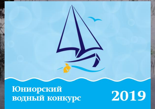
Юниорский водный конкурс