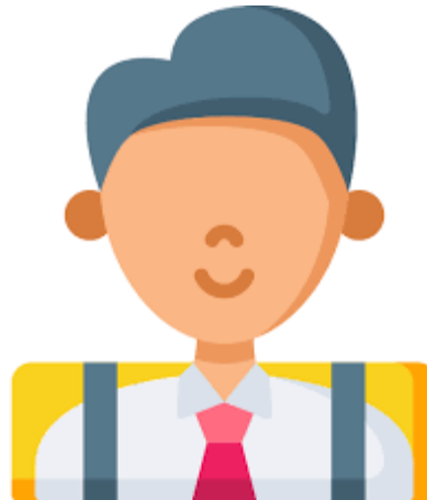
Потрет современного школьника