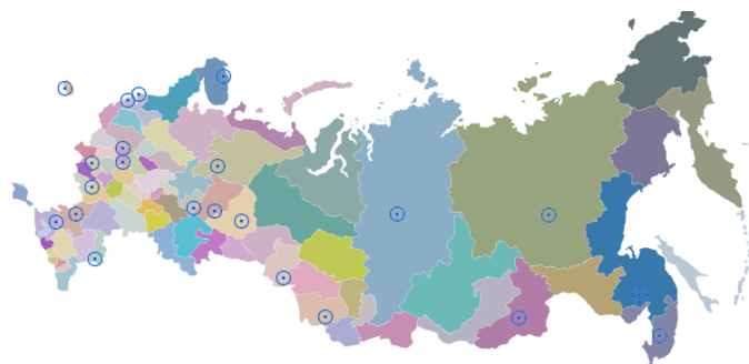
○ - площадки госпитальных школ России