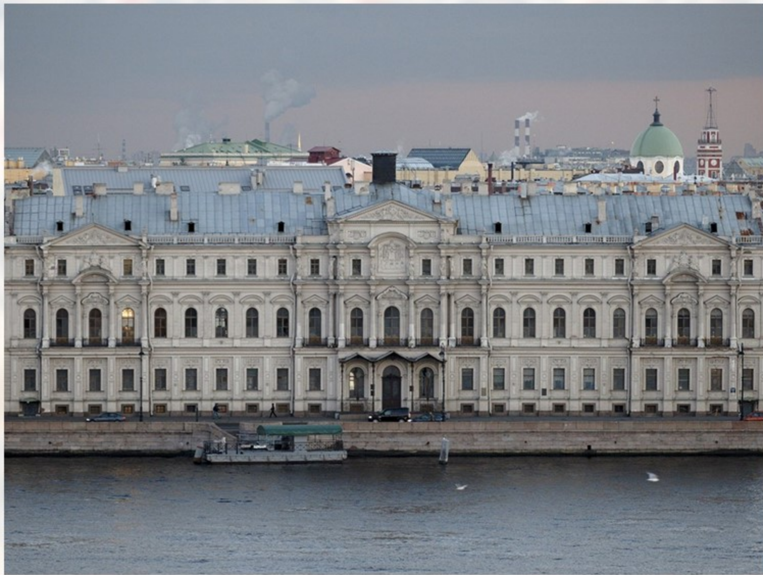
Азиатский музей – Институт восточных рукописей