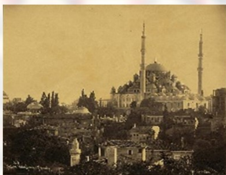
Фото мечети Фатих, 1888-1910 гг.

Вид мечети Фатих до землетрясения, сер. XVI в.