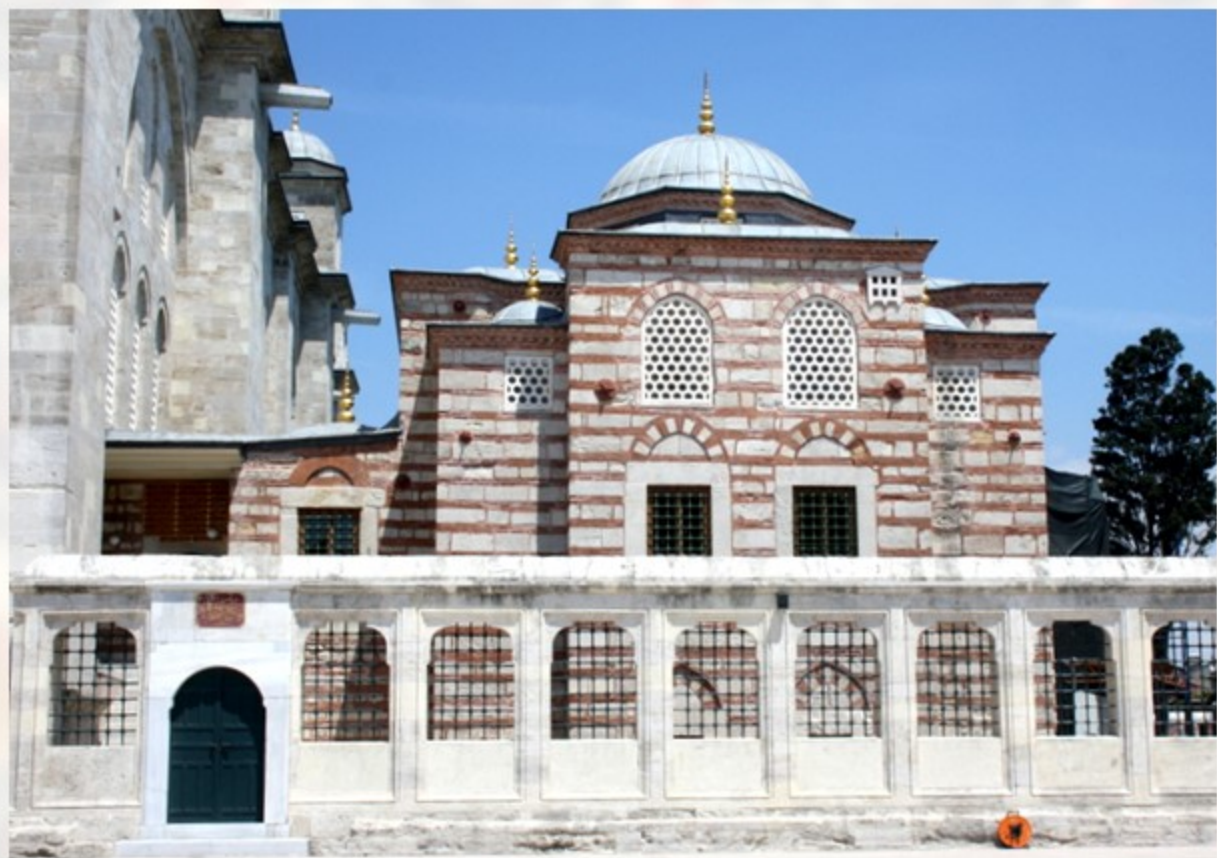
Fâtiḥ Camii Kütüphanesi Библиотека мечети Фатих (Стамбул, Турция)