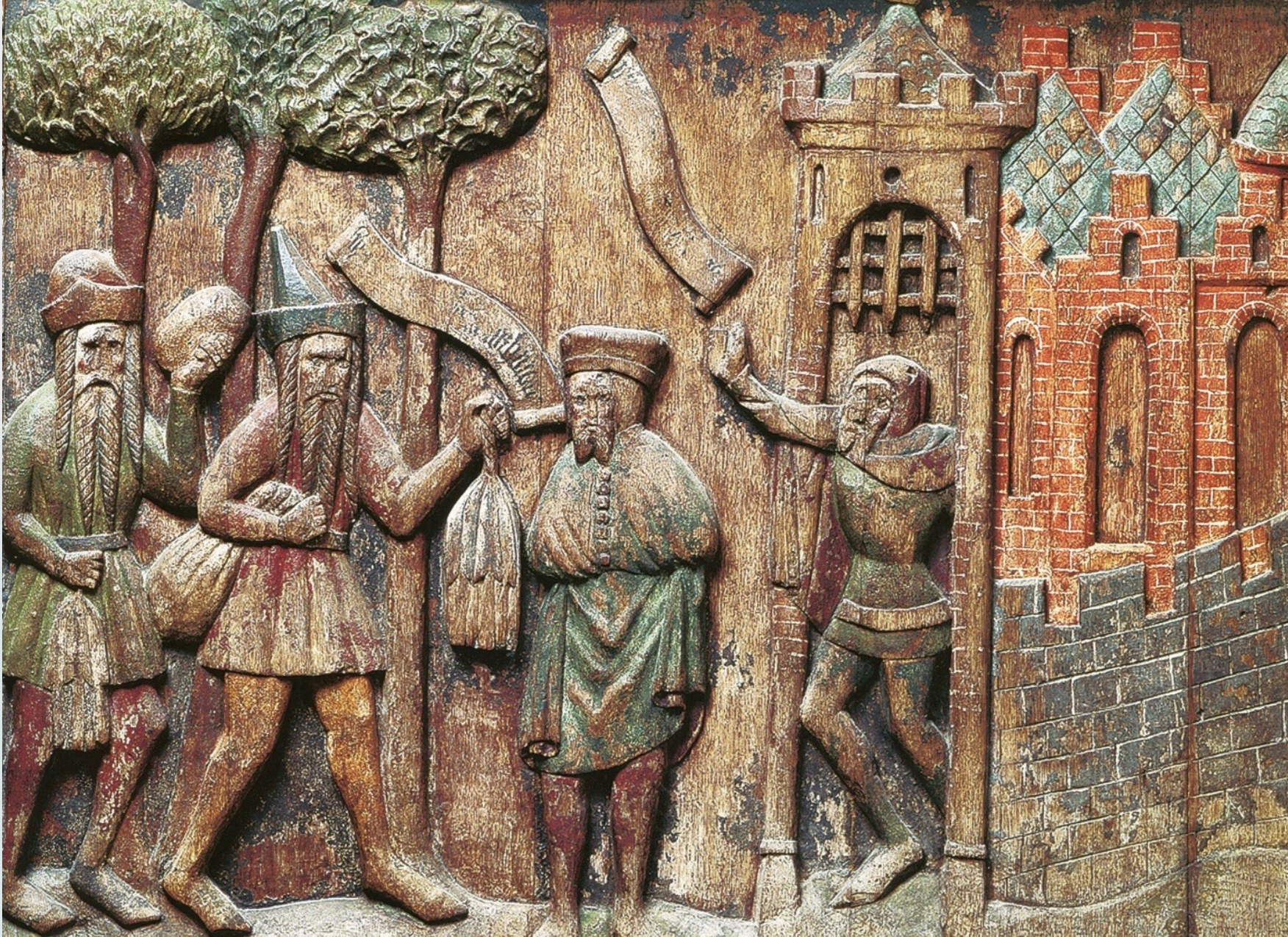
Изображение Немецкого подворья в Новгороде на скамье в Штральзунде.