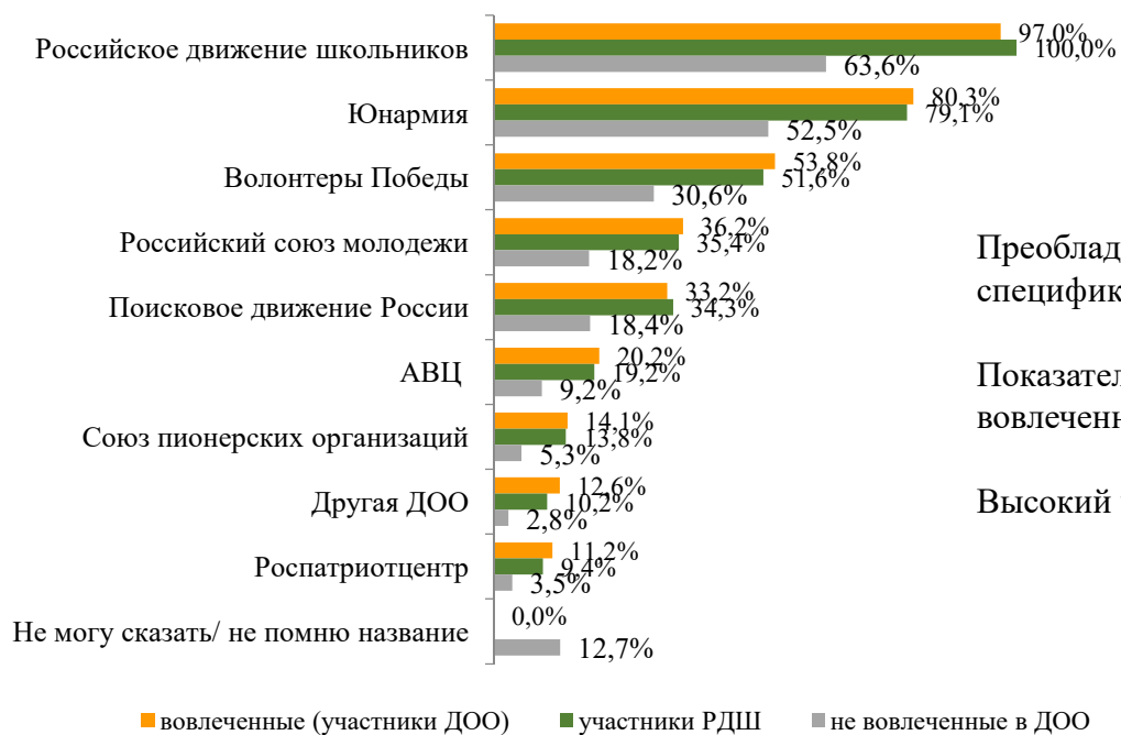
Уровень осведомленности "с подсказкой" о ДОО, ДД Школьники

Какие детские общественные организации, детские движения Вы знаете?