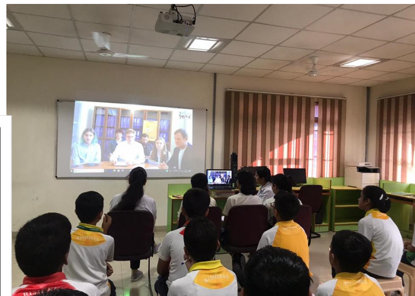
Философский бой со школьниками Rishikul Vidyapeeth Sonipat (Индия): «Традиционная vs глобальная культура»