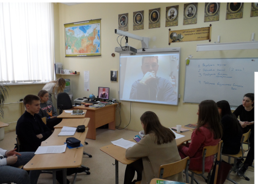
Философский бой «Китай: друг или враг?», при участии учеников школы Thornton Academy г. Сако, штат Мэн (США)