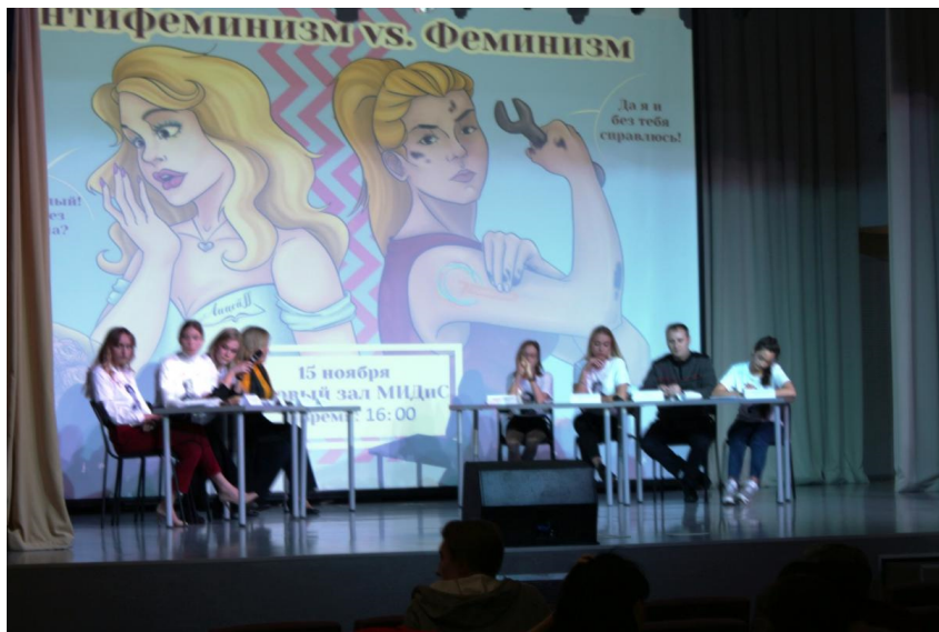
Философский бой между школами г. Челябинска: «Феминизм vs антифеминизм»