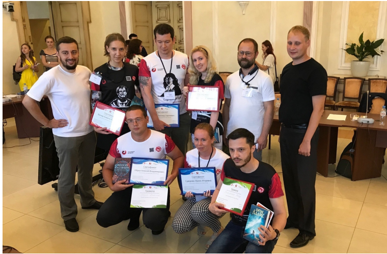
Философский бой в Общественной палате РФ: «Реальность: объективная или виртуальная?»