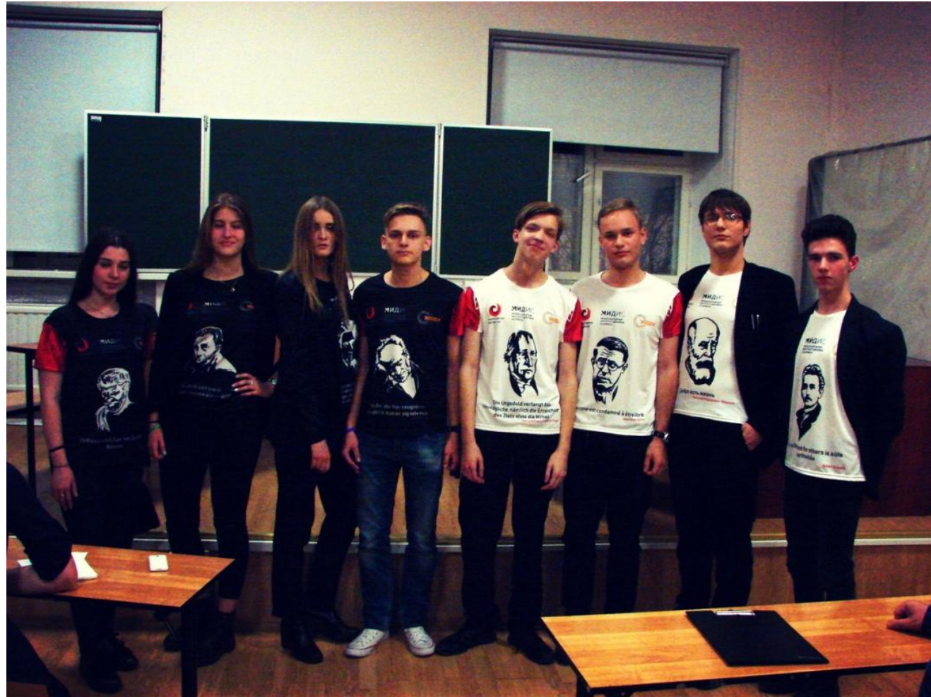
Философский бой школы "7Ключей" (г.Челябинск) и физико-математического лицея №30 из г. Санкт-Петербург в стенах Института философии СПбГУ: «Трудлюбие vs талант»