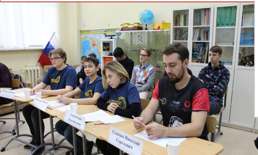
Философский бой с Азербайджанской республикой: «естественный vs искусственный интеллект»