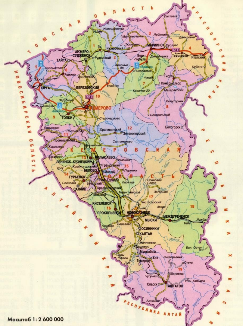
Масштаб 1: 2 600 000

По данным Министерства экономического развития Кузбасса, по состоянию на 2022 год в моногородах региона суммарно проживало более 1,5 млн человек, что составляет около 60 % от всего населения региона. При этом среднесписочная численность занятых на градообразующих предприятиях составляла 24 % от численности работников организаций)