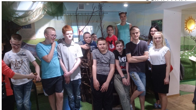
Мастер-классы и интерактивные занятия