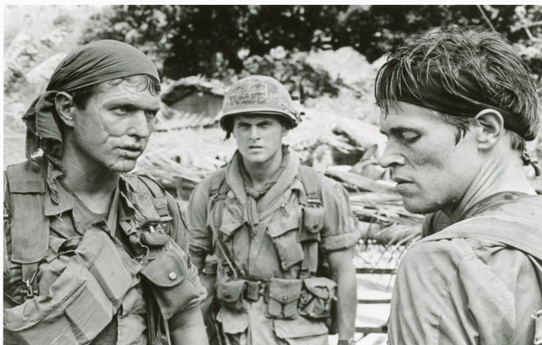
Илл. 2. Сцена из фильма «Взвод» (1986).

ду, что настолько жесткая демонстрация Вьетнамского конфликта никого не заставит усомниться в том, что эта война была настоящим адом.