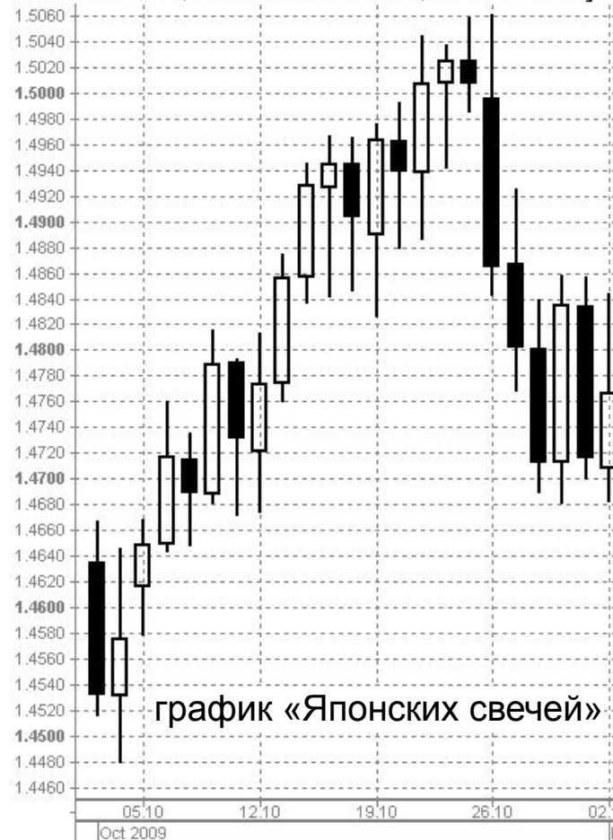
Candlestick chart, EUR/USD October 2009, time-frame = day