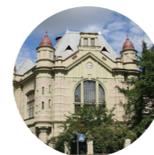
Санкт-Петербургский государственный электротехнический университет (СПбГЭТУ) «ЛЭТИ» им. В. И. Ульянова (Ленина)

Занимает лидирующие позиции в области микро- и наноэлектроники, в области разработки радиоэлектронных, информационно-телекоммуникационных и информационно-управляющих систем, в области технологий жизнеобеспечения человека и защиты окружающей среды.