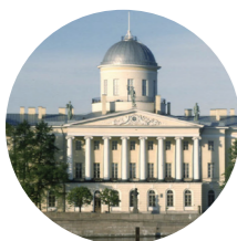
Пушкинский Дом (Институт русской литературы РАН)