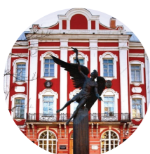
Санкт-Петербургский государственный университет