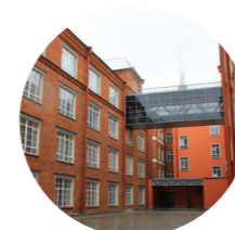
Национальный исследовательский университет Высшая школа экономики (Москва, Санкт- Петербург, Пермь, Нижний Новгород)