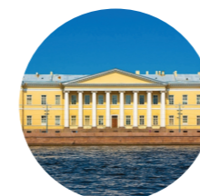
Санкт-Петербургский научный центр Российской Академии наук (1724)

*по данным сайта Комитета по образованию СПб http://study-spb.ru .