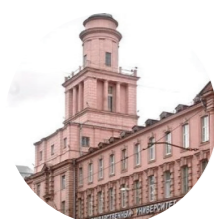
Национальный исследовательский университет ИТМО