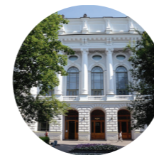
Санкт-Петербургский политехнический университет Петра Великого