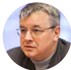
Ректор Кузьминов Ярослав Иванович